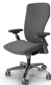
Выход на Пенсию