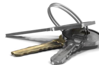
Смена места Жительства