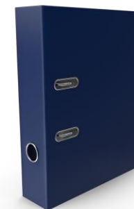
Восстановление утерянных Документов