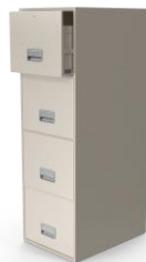
Открытие Своего Дела