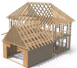
Индивидуальное жилищное Строительство